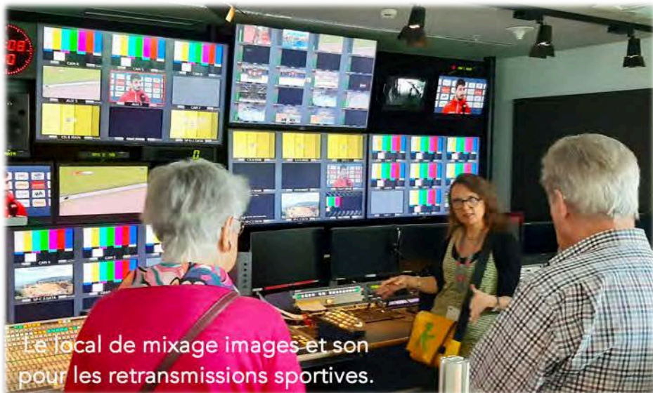
Le local de mixage images et son pour les retransmissions sportives.

Enfin il y avait la loge du maquillage / coiffage où les femmes passent 30 min et les hommes 15 min avant de venir sur scène.