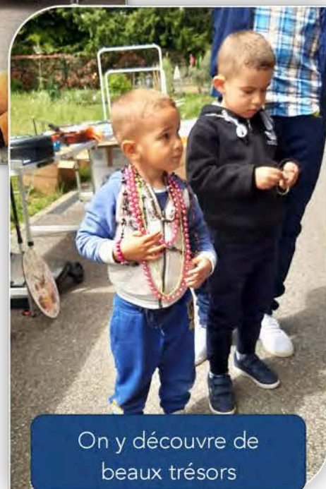
On y découvre de beaux trésors