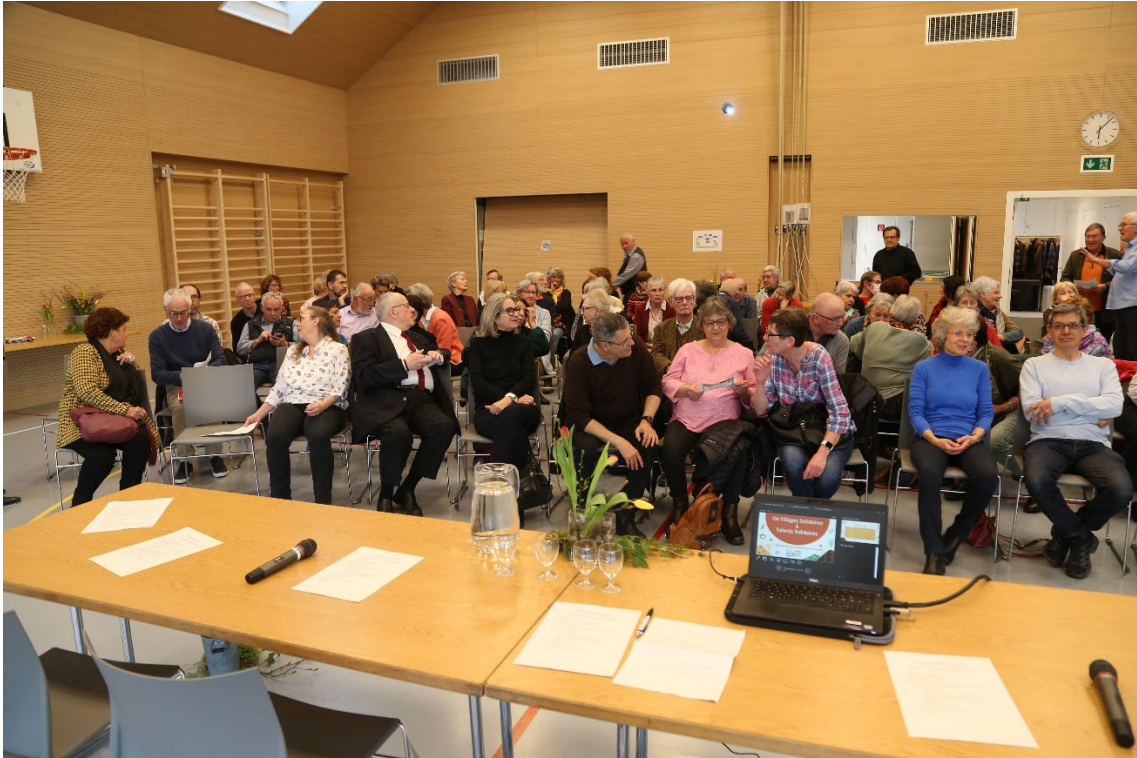
Assemblée constitutive – 24 mars 2023