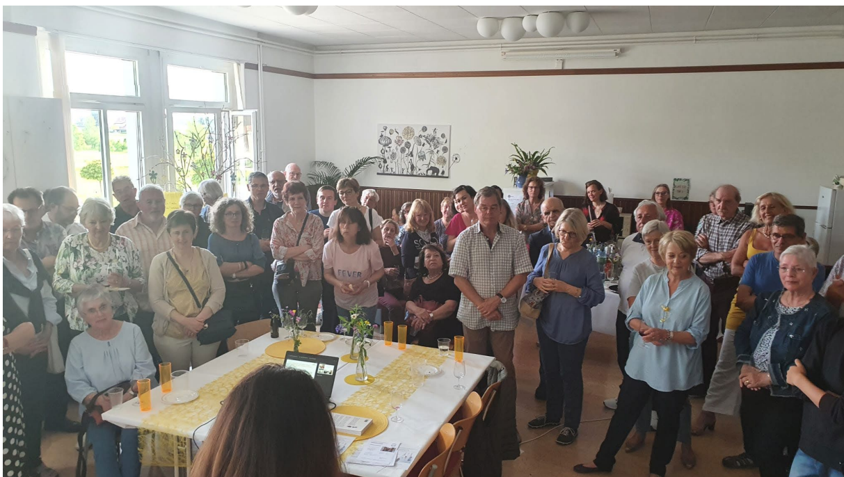
Inauguration du local – 13 mai 2022