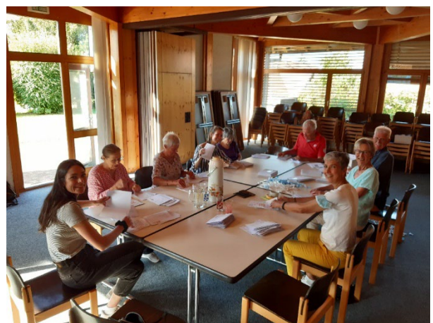
Mise sous pli des invitations au forum – septembre 2021

La Commune a mis à leur disposition, à la rue du Village de Cugy, les anciens locaux de l'UAPE, qu'elle a rénové avant leur arrivée.