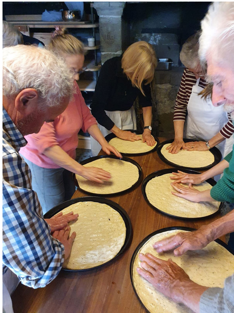
Préparation de pizzas à Morrens – 11 mai 2023