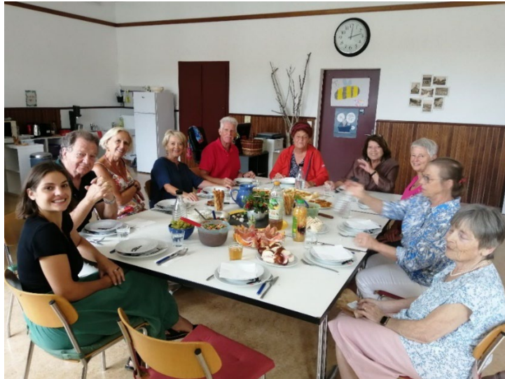
Repas canadien - mars 2022

Un groupe Identité visuelle a travaillé sur le logo et la brochure de présentation, qui a été offerte aux participants de l'Assemblée constitutive du 24 mars 2023, et divers supports de communication (par exemple une banderole).