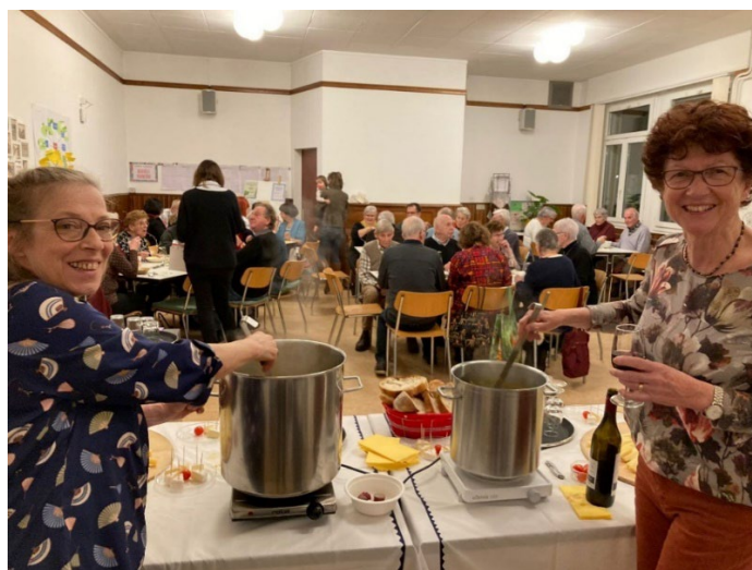
Soupe de l'amitié – février 2023