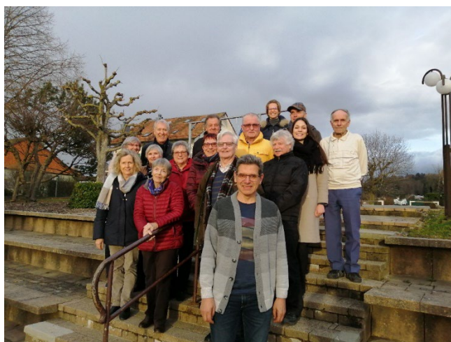
Groupe habitants – mars 2020

Le groupe habitants (GH) a réuni toutes les trois semaines (une fois par mois en fin de projet) les seniors intéressés à participer activement au développement du processus.