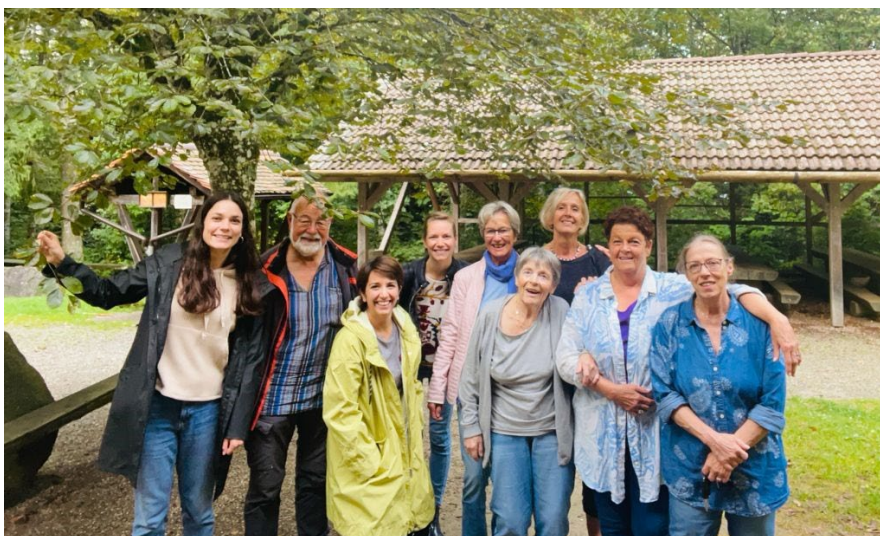
Sortie d groupe – septembre 2021