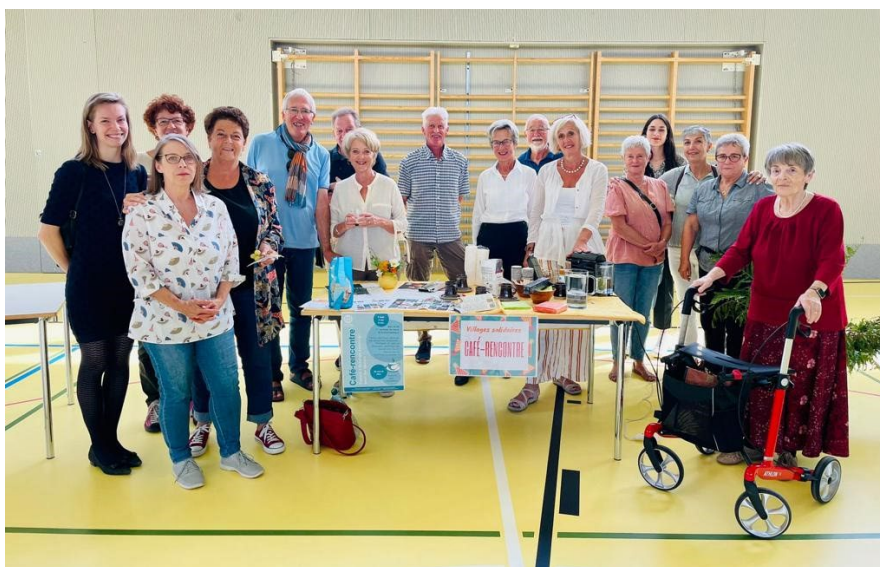
Deuxième forum – 2 octobre 2021