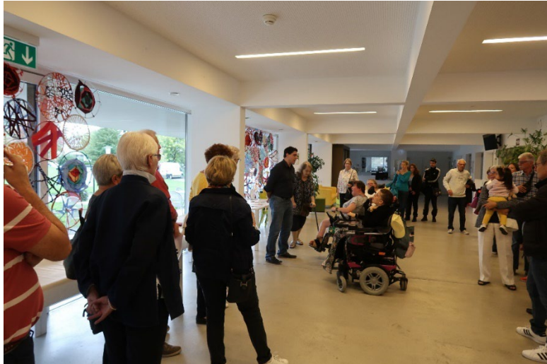
Exposition Talents cachés – septembre 2022